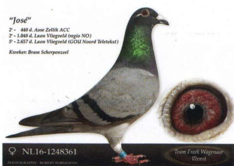
Duif NL 16-1248361 'José'