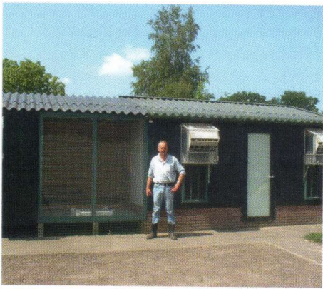
Hokken van Freek