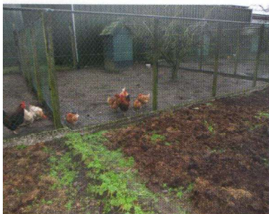
Kippen in ren

Heel gezellig en de beleving was intens, al stelde het sportief gezien nog niet veel voor'.