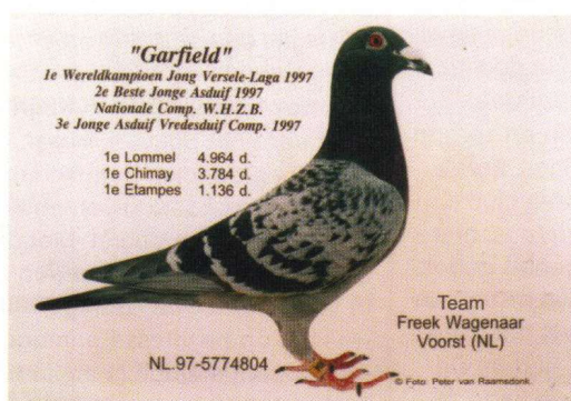
Duif wereldkampioen 'Garfield'