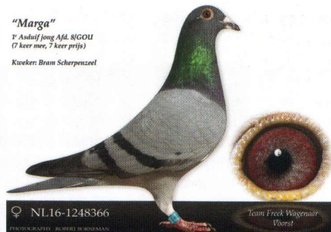
Duif NL 16-1248366 'Marga'