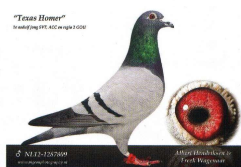
Duif NL 12-1287809 'Texas Homer'