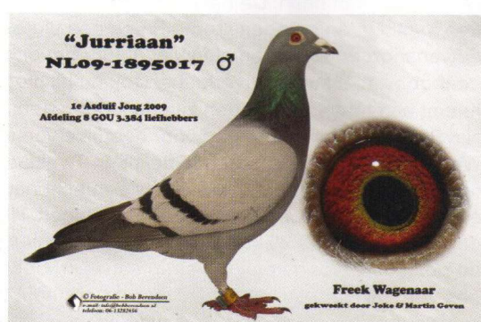
Duif NL 09-1895017 'Jurriaan'