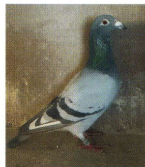
'Teletekst 458' 1e Olympiadeduif Jong Olympiade 2022